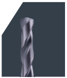
VHM-Bohrer Solid carbide drills Punta elicoidali in metallo duro integrale

Optional ohne Aufpreis auch mit Weldon-Schaft [DIN 6535-HB] lieferbar. d1 ≥ 3,0 mm / d2 ≥ 6,0 mm. / Also available with Weldon-shank [DIN 6535-HB] without extra charge. / Anche disponibili con attacco Weldon [DIN 6535-HB] senza prezzo aggiuntivo. Details zum Sonderanschiff: Siehe Kapitel „Technische Informationen“ / Details on the special point shape: See chapter „Technical information“ / Dettagli sulla affilatura speciale: Capitolo „Informazioni tecniche“