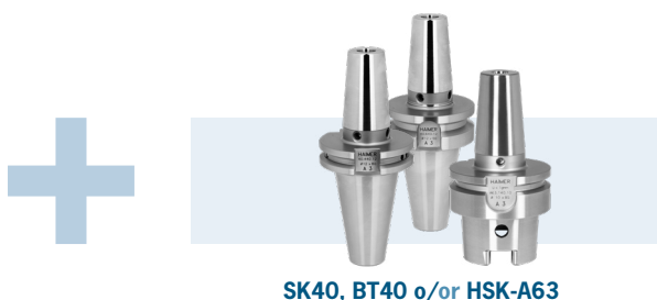
SK40, BT40 o/or HSK-A63

3 Standard Shrink Fit Chucks short (Ø 6–20 mm) for free!