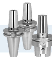
SK40, BT40 o/or HSK-A63

3 Standard Shrink Fit Chucks short (Ø 6–20 mm) for free!